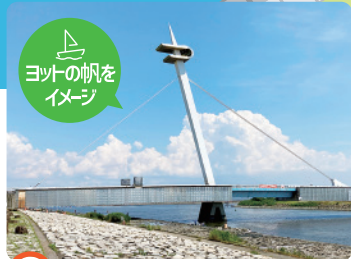
A 葛西渚橋 西なぎさと葛西臨海公園をつなぐ橋。*自転車は入れません。