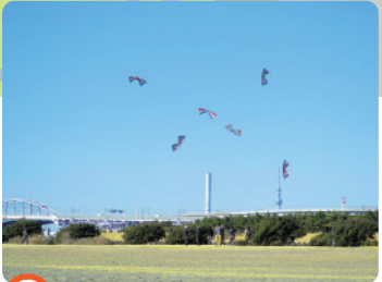
B 海風の広場 草草が広がっており、潮風に乗せてスポーツカイトなどが楽しめます。