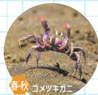
春秋 コメツキガニ