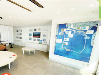
C いきものステーション 葛西海浜公園の自然情報を展示しています。*2F:葛西海浜公園管理事務所