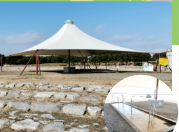
テント・水場 既存の大型テントの下に、シャワーヘッド付きの足洗い場があります。