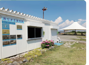
案内所 スタッフが常駐し、公園の様々な情報を発信しています。