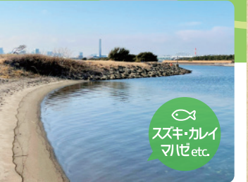
つりスポット 西なぎさ外周でつりが楽しめます。*投げ釣りはできません。