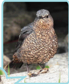
釣糸が足に絡まった インビヨドリ

園内には釣り人が使用した釣糸や釣針、ルアーなどが落ちていたり、その影響で釣糸やルアーが足に絡まった野鳥が確認されています。