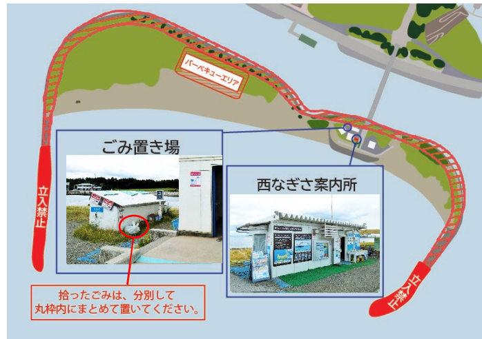
葛西海浜公園 西なぎさマップ