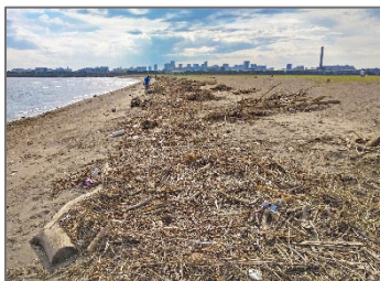
葛西海浜公園西なぎさ夏場の写真